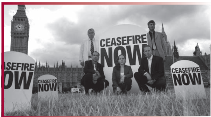
Martin Bell (ancien parlementaire et correspondant de guerre) avec des représentants de Care International, Muslim Council of Britain, Save the Children et Oxfam devant le parlement britannique.

Le fait que nos partenaires soient engagés dans des alliances ad hoc sur des initiatives spécifiques a permis à Crisis Action d'être réactif et efficace face à une situation qui évoluait rapidement.